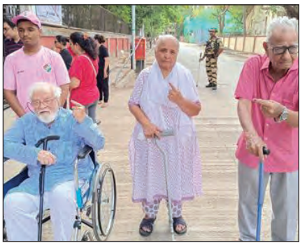
लोकसभा चुनाव के पांचवें चरण के मतदान में बुजुर्गों ने अपने मताधिकार का प्रयोग किया।