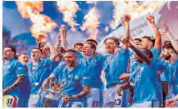
मैनचेस्टर सिटी 2-1 से आगे थी। मैच के 59वें मिनट में रोड्री ने गोल कर मैनचेस्टर सिटी को 3-1 से आगे कर दिया और अंत में यही

एजेंसी मैनचेस्टर। मैनचेस्टर सिटी ने रविवार को वेस्ट हैम यूनाइटेड को 3-1 से हराकर लगातार चौथा प्रीमियर लीग खिताब जीतकर इतिहास रच दिया। मैनचेस्टर सिटी ने मैच में आक्रामक शुरुआत की और केवल 79वें सेकेंड में ही फिल फोडेन ने गोल कर अपनी टीम को 1-0 की बढ़त दिला दी। इसके बाद 18वें मिनट में फोडेन ने जेरेमी डोको के क्रॉस को गोल पोस्ट में डालकर बढ़त को दोगुना कर दिया। हालांकि, मोहम्मद कुदुस ने हाफटाइम से ठीक पहले (42वें मिनट) में गोल कर वेस्ट हैम का खाता खोल दिया। हाफ टाइम तक